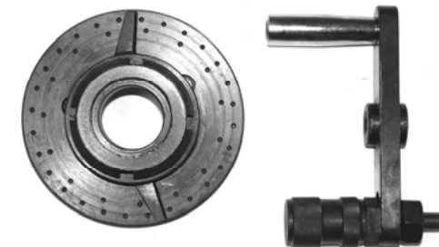
Код для заказа 23420