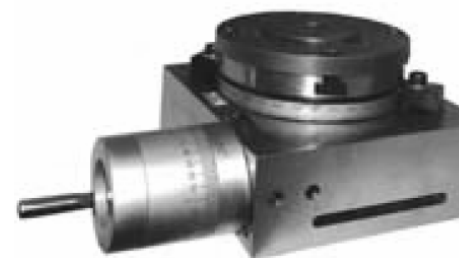
Код для заказа 23414